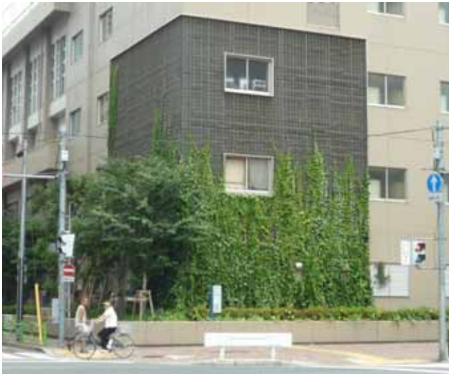
事例：公立小学校（東京都内）