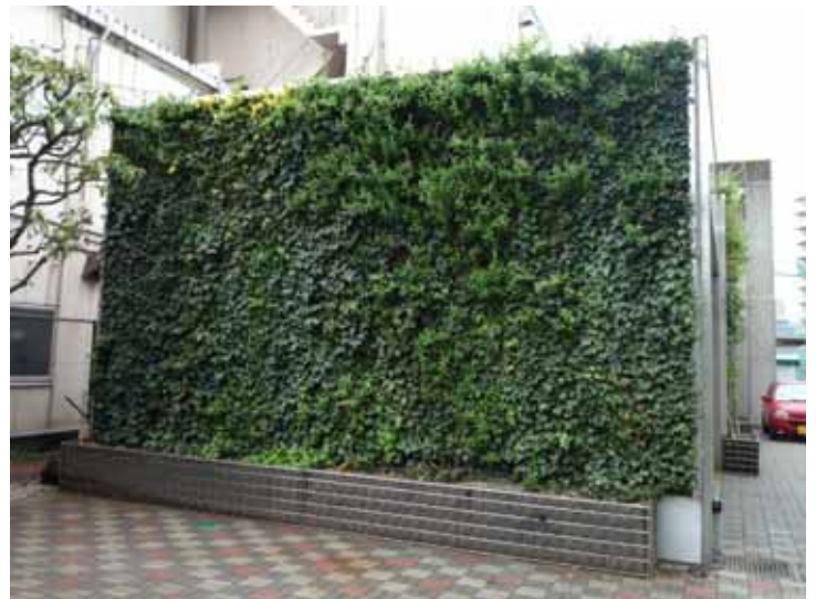
事例：公園施設（東京都内）