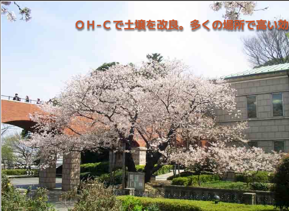
▲ うんてい 芸亭の桜/ソメイヨシノ古木（推定樹齢70～80年）神奈川県横浜市