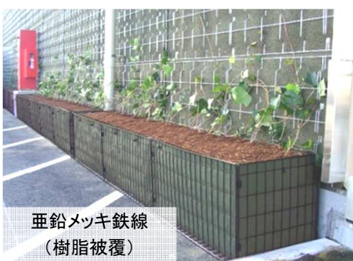
亜鉛メッキ鉄線 (樹脂被覆)