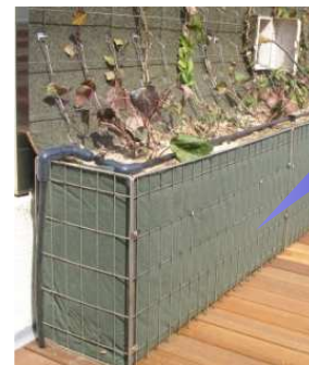
植栽幅が取れない場所に 薄型プランターを設置した事例