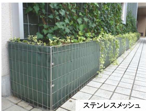
ステンレスメッシュ

金属メッシュと不織布を組合わせた低コスト軽量プランターです。メッシュの材質はステンレスのほか、より安価な亜鉛メッキ鉄線(樹脂被覆)もございます。通気性に優れているため、プランター内の全体に根が広がります。