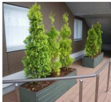
壁面緑化以外に利用した事例 中木を植栽